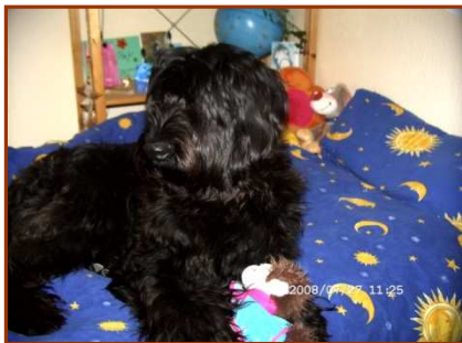
Eindrücke aus dem Haus und von unserem Familienhund NALA